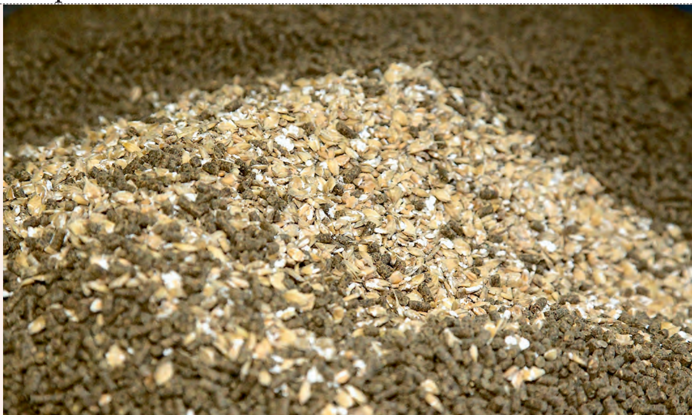
Kraftfoder: Vestjyderne opnår de laveste priser på kraftfoderblandinger, det viser en opgørelse fra KvægNøglen. Arkivfoto.